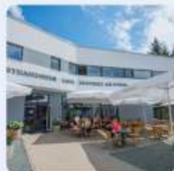
Kunsthandwerk - Café - Rösterei am Stern

Bitte geben Sie gleich bei der Anmeldung Ihren Wunsch an.